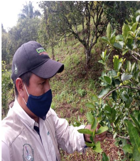
Figura 3. Exploración para detección de síntomas de Leprosis

b) Exploración. Con el fin de detectar los problemas fitosanitarios descritos en el Manual Operativo de la Campaña contra Plagas Reglamentadas de los Cítricos, se realizó la revisión de las 40 plantas que componen los 46 sitios de monitoreo ("T" simple), es decir un total de 1,840 plantas, no detectándose síntomas de otros problemas fitosanitarios de interés cuarentenario.