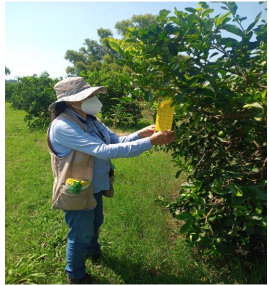
Figura 2. Trampas establecidas y revisadas para el monitoreo del PAC.

El promedio de diaforinas obtenido en el mes de junio fue de 4.23 diaforinas/trampa/mes.